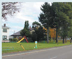
⑬清流東団地公園前