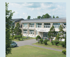
㉛東川第一小学校前 (第一コミセン)