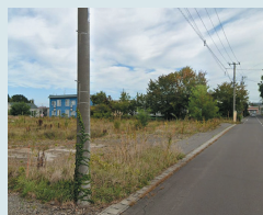
⑭西町2丁目9番 東川神社裏前