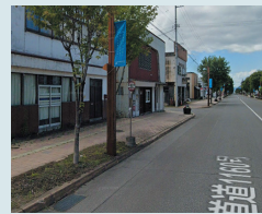
⑪東町2丁目上り 電気軌道バス停前