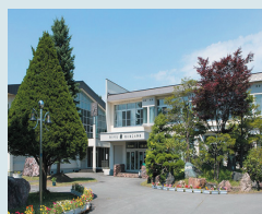
㉜東川第二小学校前