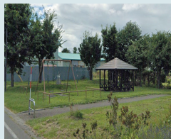
⑦東町4丁目5番公園前