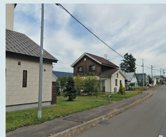
⑩南町1丁目8番緑地前