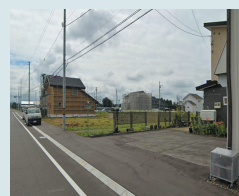
㉓ノースヴィレッジ 緑地前