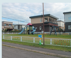
⑲西町5丁目4番 公園前