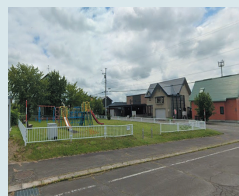
⑮西町2丁目10番 公園前