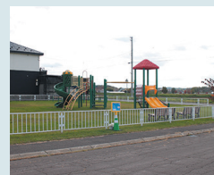
⑱西町4丁目8番 公園前