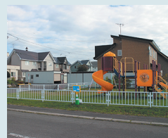
⑰西町3丁目13番 公園前