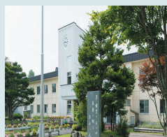
㉝東川第三小学校前