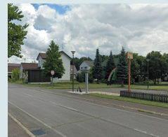
⑫レインボー公園前