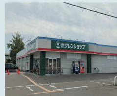
⑨ホクレンショップ前