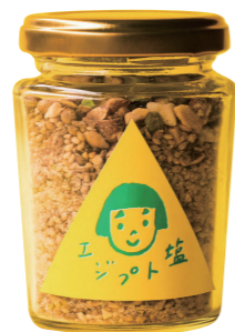
SSAW BIEI たかはしよこさんの エジプト塩 異国気分を味わえる、塩・ナッツ・スパイスをブレンドした魔法の万能調味料。今年も冬のお料理に