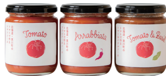
青木農場のトマトで作ったトマトソース

果実味のあるエチオピアナチュラルをベースにしたクリスマスブレンド。雪景色をイメージしたラベルは salvia によるデザイン