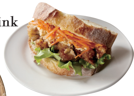
SONOまんなの パンとサンドイッチ 人気のクロワッサンのほか、お腹いっぱいになりそうなサンドイッチや香りの良いハードパンもおすすり