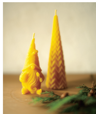
lämpö の蜜蝋キャンドル

今年はグラデーションカラーがきれいなミトンが新たに登場。ラトピアのかごも揃っています