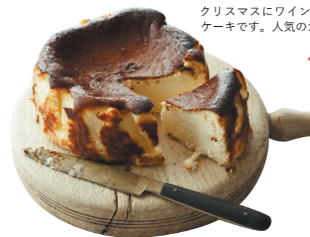
カオリーヌ菓子店 かのうかおりさんの チーズケーキ

ホワイトやストロベリーチョコに、色とりどりのドライフルーツをのせた美しいチョコレートはギフトにぴったり