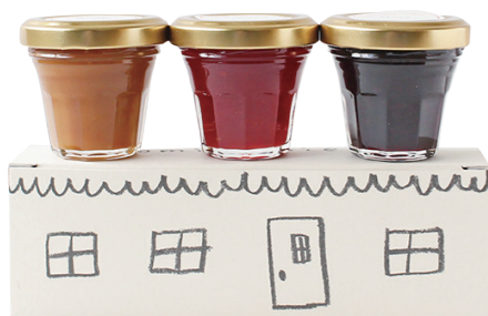
romi-unie コンフィチュール いがらしろみさんのジャム

今年は「romi-unie のジャム屋台」が登場！ジャムバタークリームを挟んだかわいいコッパンを召し上げ