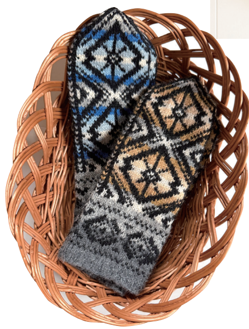
UPE のラトピアミトン

今年はグラデーションカラーがきれいなミトンが新たに登場。ラトピアのかごも揃っています