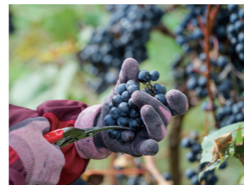
東川ワイン kitoushi 東川町産のぶどう（品種：セイベル）から生まれたワイン、今年も美味しく仕上がっています