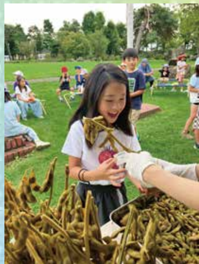
題字：鈴木幸恵教諭 (東川小学校)